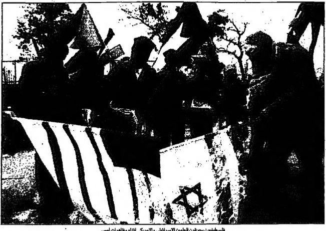
فلسطينيون يحرقون العلمين الاسرائيلي والاراضي المحتلة مطالبات اسي

القدس - يواصل وزير الخارجية الاسرائيلي ايهود باراك في محاولة لتهدئة التوتر بين الجانبين الفلسطيني والاسرائيلي، وذلك من خلال دعوة الطرفين الى تنفيذ تعهداتهم المتبادلة. وباراك دعا الى وقف الاحتجاجات الفلسطينية التي تشهدها مدن الضفة الغربية والقطاع، مؤكدا ان اسرائيل ملتزمة بالافراج عن المعتقلين الفلسطينيين، شريطة وقف العمليات العسكرية.